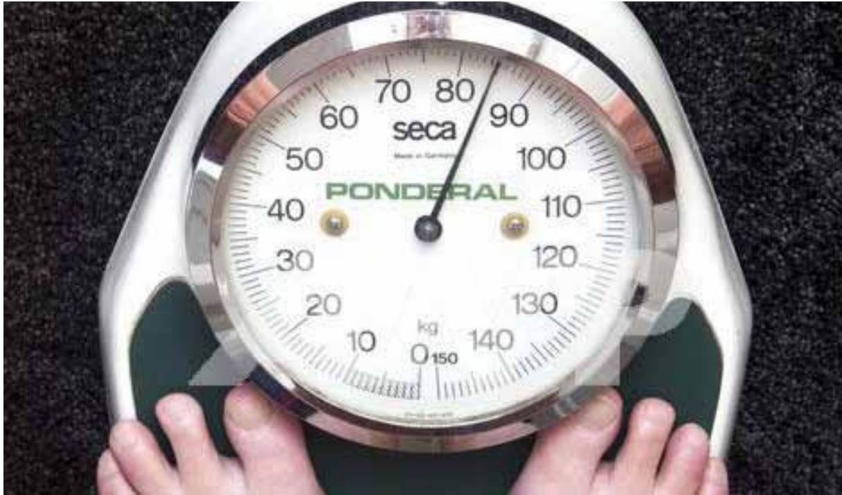
Dertien procent van de Nederlandse kinderen heeft overgewicht.